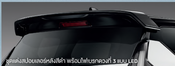
ชุดแต่งสปอยเลอร์หลังสีดำ พร้อมไฟเบรกวงที่ 3 แบบ LED