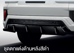
ชุดตกแต่งด้านหลังสีดำ