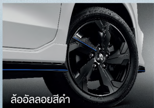
ล้ออัลลอยสีดำ