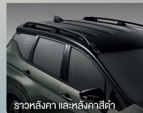
ราวหลังคา และหลังคาสีดำ