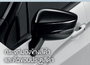
กระจกมองข้างสีดำ และคิ้วขอบประตูสีดำ