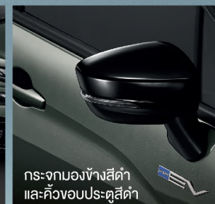
กระจกมองข้างสีดำ และคิ้วขอบประตูสีดำ