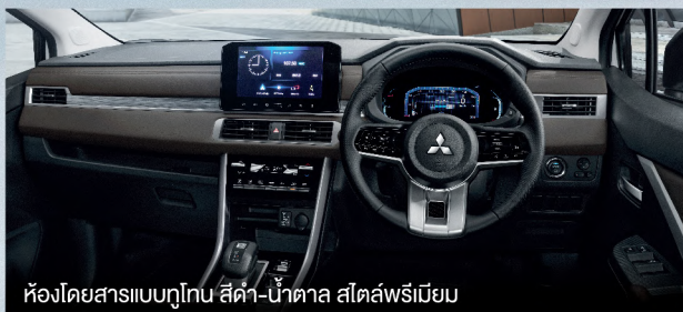
ห้องโดยสารแบบทูโทน สีดำ-น้ำตาล สไตล์พรีเมียม