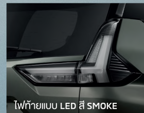
ไฟท้ายแบบ LED สี SMOKE