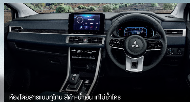
ห้องโดยสารแบบทูโทน สีดำ-น้ำเงิน เทปไม้จริง