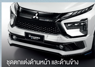
ชุดตกแต่งด้านหน้า และด้านข้าง