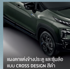
แผงตกแต่งข้างประตู และซุ้มล้อ แบบ CROSS DESIGN สีดำ