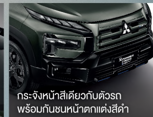
กระจังหน้าสีเดียวกับตัวรถ พร้อมกันชนหน้าตกแต่งสีดำ