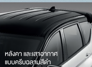
หลังคา และเสาอากาศ แบบครีบลานสีดำ