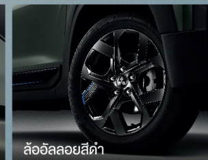
ล้ออัลลอยสีดำ