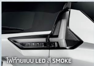
ไฟท้ายแบบ LED สี SMOKE

เติมเต็มทุกไลฟ์สไตล์ ด้วยรถนอกประสงค์ 7 ที่นั่ง พร้อมชุดแต่งดีไซน์พิเศษรอบคัน ให้คุณและครอบครัว เป็นตัวของตัวเองในทุกเส้นทาง